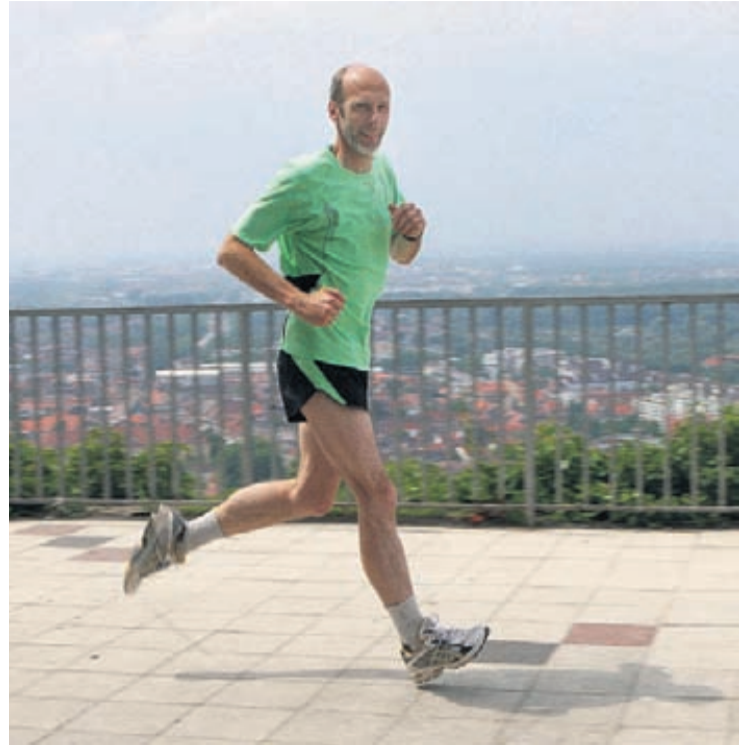
Der Turmberg in Durlach zählt zu den bevorzugten Laufrevieren von Klaus Stapf.