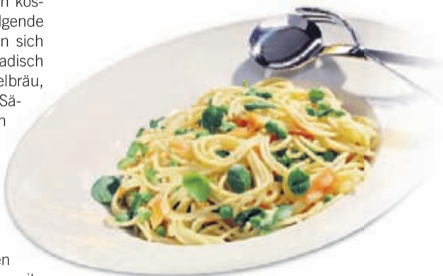
Viele Kohlenhydrate müssen die Läufer zu sich nehmen.

2. Karlsruher Tanz-Marathon: Nach dem gelungenen Auftakt im Vorjahr werden die Zuschauer und Läufer erneut von über 80 Tanzgruppen an rund 40 Punkten angefeuert und unterhalten (siehe Streckenplan auf den Seiten 8 und 9 sowie Seiten 10 und 11).