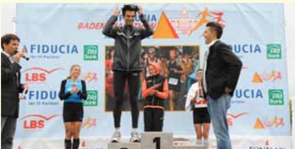
♣ BADEN-MARATHON, KARLSRUHE – MOOR-MARATHON, GOLDENSTEDT Zwei Außenseiter im Finale und doch ein eindeutiger Sieger: der Baden-Marathon! Wer den einzigen Marathon seines Leben geschafft hat, will eine Erinnerung, die alles überdauert, und da kommt der Moor-Marathon mit einem Holztaler? Der Sieg geht an Karlsruhe mit seiner goldglänzenden Metallmedaille (s. rechts).

Die Trophäe ist entscheidend, denn wenn Sie nur einen Marathon laufen, soll diese schon etwas hermachen.