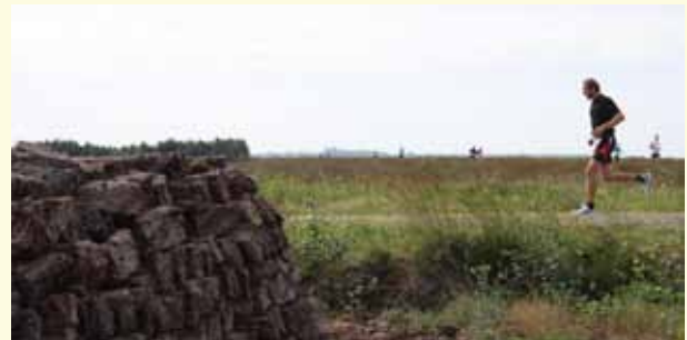
NEW-YORK-MARATHON – ♣ MOOR-MARATHON, GOLDENSTEDT Wer in New York startet, muss einiges in Kauf nehmen: fünf Stunden Zeitverschiebung, eine (leicht) profilierte Strecke, extrem frühes Aufstehen am Renn-tag. All das tut man gern, wenn man etwas erleben will, aber für den ersten Marathon erschwert es das Unterfangen extrem. Da hat man's im Moor leichter.