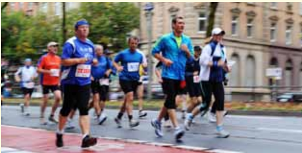
♣ BADEN-MARATHON, KARLSRUHE – VIENNA CITY MARATHON, WIEN Ob man seine Vorbereitung verummumt im Tiefschnee absolvieren muss oder bei angenehmen Temperaturen in kurzer Hose, macht schon einen Unterschied. Und da man sich auf Karlsruhe (23.9.) im Sommer, auf Wien (15.4.) im Winter vorbereiten muss, zieht der Baden-Marathon ins Finale. Wer hätte das gedacht?

Es ist wichtig zu wissen, welche besonderen Anforderungen das Rennen an den Läufer stellt. Je geringer die Ansprüche, desto leichter fällt das Training.