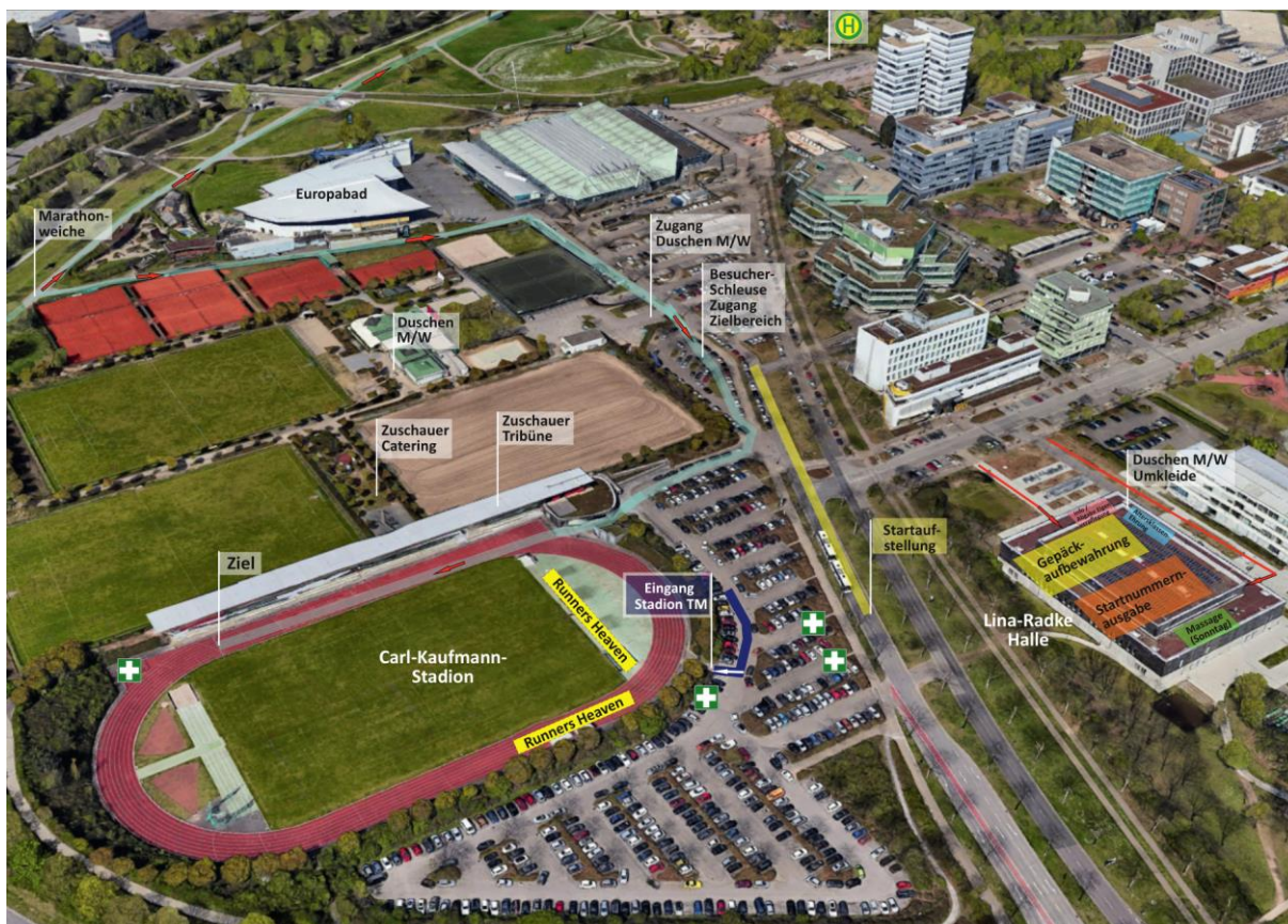
Allgemeiner Lageplan des Zielbereichs im Umfeld des Carl-Kaufmann-Stadions