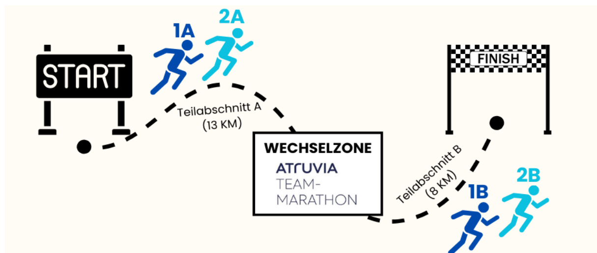
Ablauf Atruvia Team-Marathon

Marathon-Weiche: Ca. 600 m vor dem Ziel treffen die Schlussläufer auf die Marathonweiche, hier müssen sie (wie alle Halbmarathonläufer) nach rechts abbiegen (s. S. 4) und weiter Richtung Stadion bzw. ins Ziel laufen. Dort erhalten beide Schlussläufer 1B und 2B jeweils zwei Medaillen: eine für sich sowie zur Weitergabe an den vorangegangenen Startläufer. Ein gemeinsamer Zieleinlauf ist nur möglich, wenn die Startläufer rechtzeitig bis zum Zieleinlauf der Schlussläufer am Carl-Kaufmann-Stadion ankommen (s. Abschnitt 4: „Nach den Wechseln“).